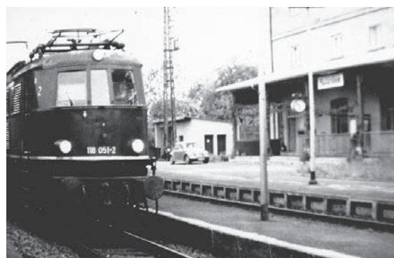
Letzter Halt in Mainbernheim am 22.5.1982