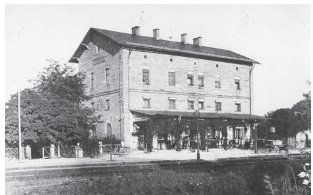
Der Mainbernheimer Bahnhof

Die Menschen auf dem flachen Land bestaunten die vorbeifahrenden Eisenbahnzüge wenn sie draußen auf den Feldern arbeiteten. Nicht nur „Auf der schwäb'sche Eisebahne wollt emol e Bäuerle fahre...“. Auch drei Mönchsondheimer Bauern wagten die Fahrt mit der „Fränk'schen Eisenbahn. Das diesbezügliche Mundartgedicht, in dem ihrem Abenteuer berichtet wird, finden Sie im eingangs genannten Jahrbuch des Landkreises 2016, das im Buchhandel sowie über die Stadt Mainbernheim zum Preis von 24,90 € bezogen werden kann.